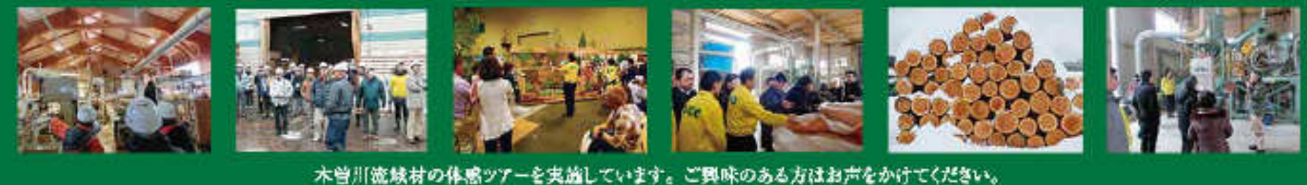
木曾川流域材の体感ツアーを実施しています。ご興味のある方はお声をかけてください。